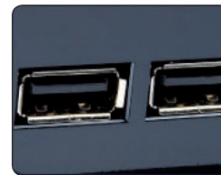
2 USB порта