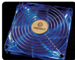
Четыре синих светодиода