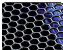
Сотовидная структура из стали