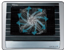
Широкая площадь охлаждения